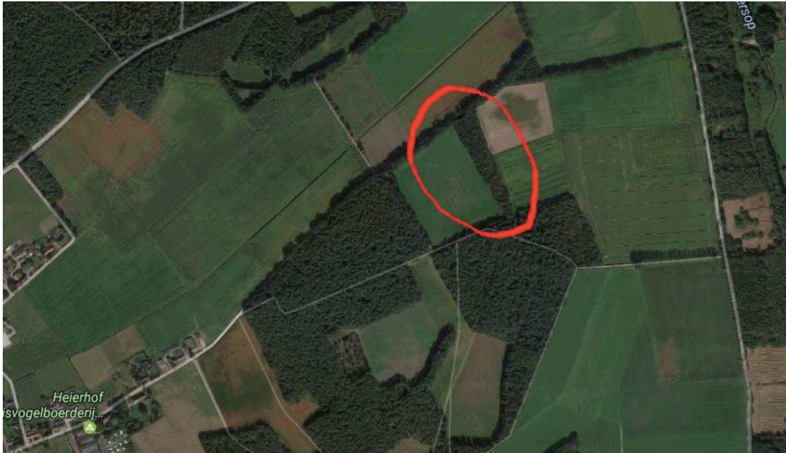
Afbeelding 5.1 Ligging, zie rode cirkel, van de houtwal Heiereind te Riethoven.