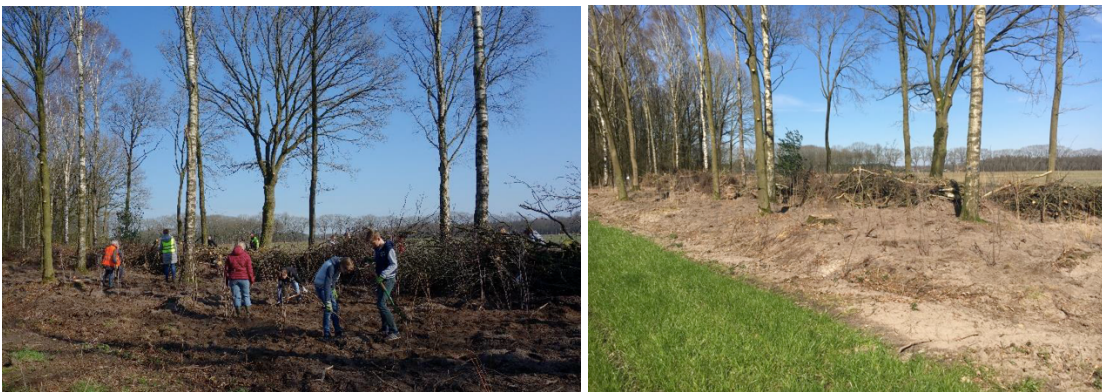
Afbeelding 5.4 Aanplanten struiken door de basisschoolleerlingen.