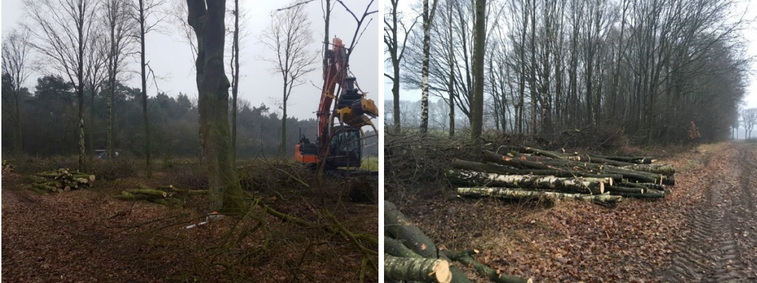
Afbeelding 5.3 Kappen van de grote bomen.